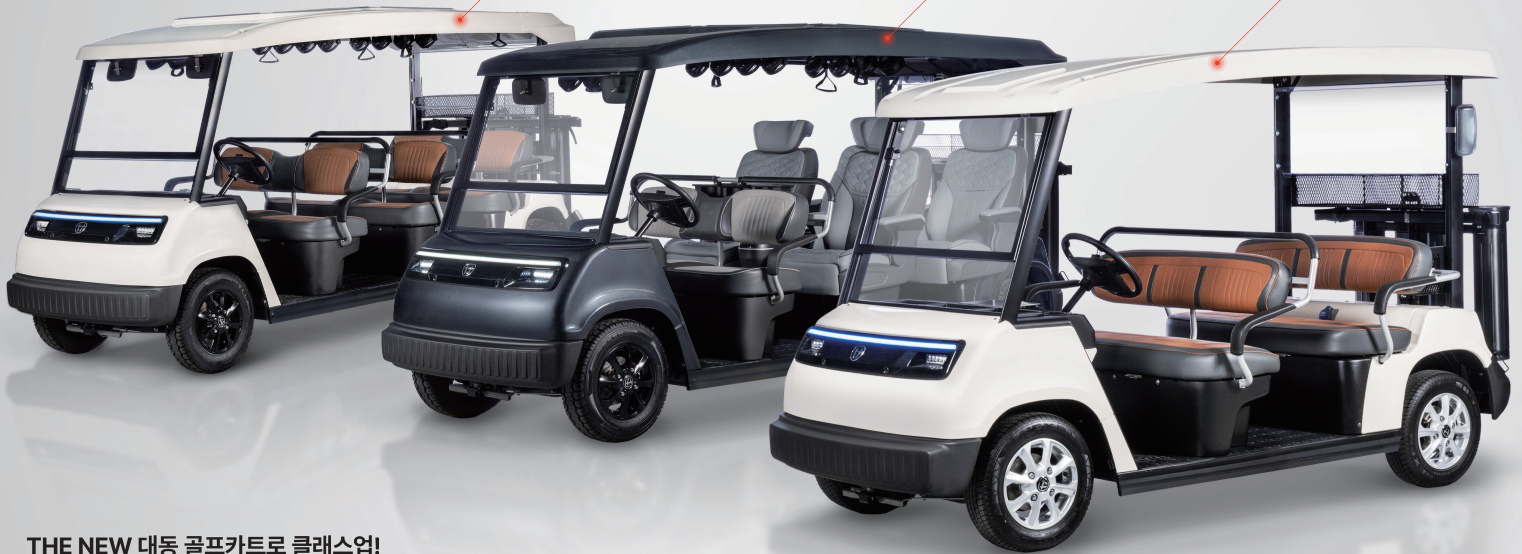
2열 스탠다드 카트 GA300

THE NEW 대동 골프카트로 클래스업! 페이스 리프트로 확 달라진 품질과 디자인