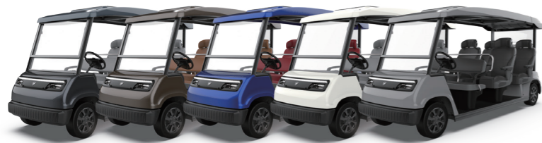
Gray Metallic Bronze Metallic Blue White Gray