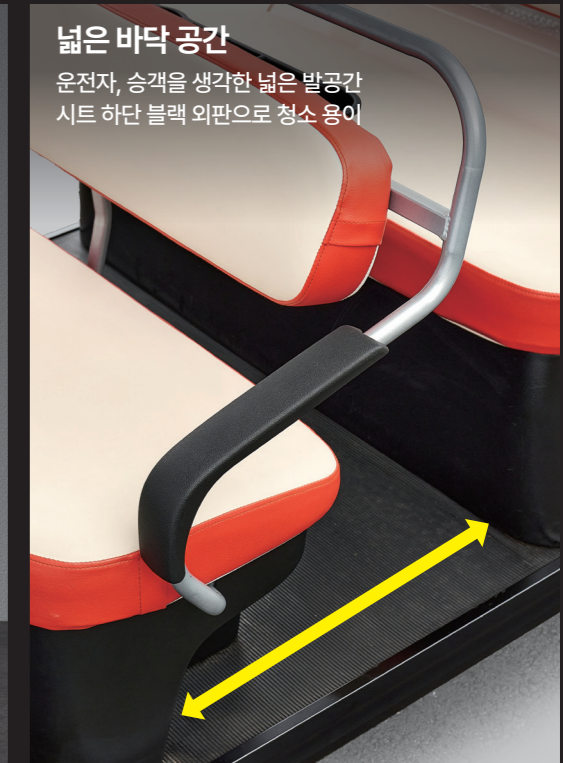
넓은 바닥 공간