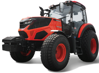
100마력 트랙터 HX900