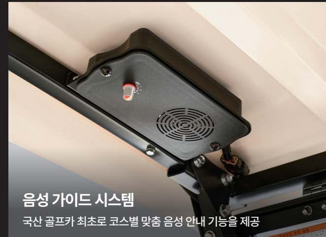
음성 가이드 시스템