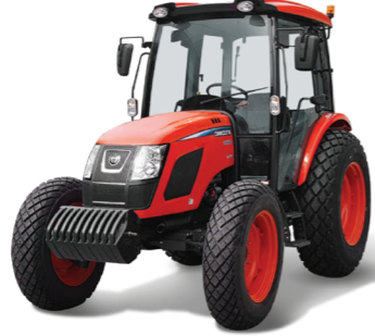
74마력 트랙터 RX730