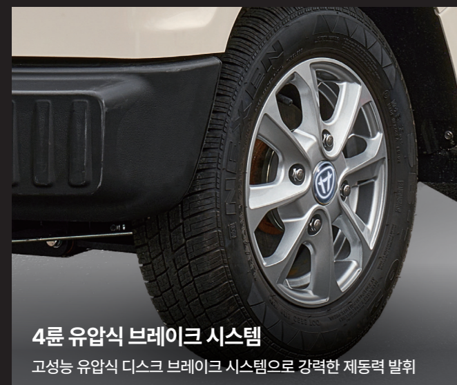
4륜 유압식 브레이크 시스템