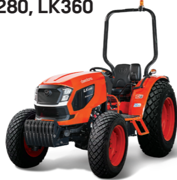
25 & 35마력 트랙터 LK280, LK360